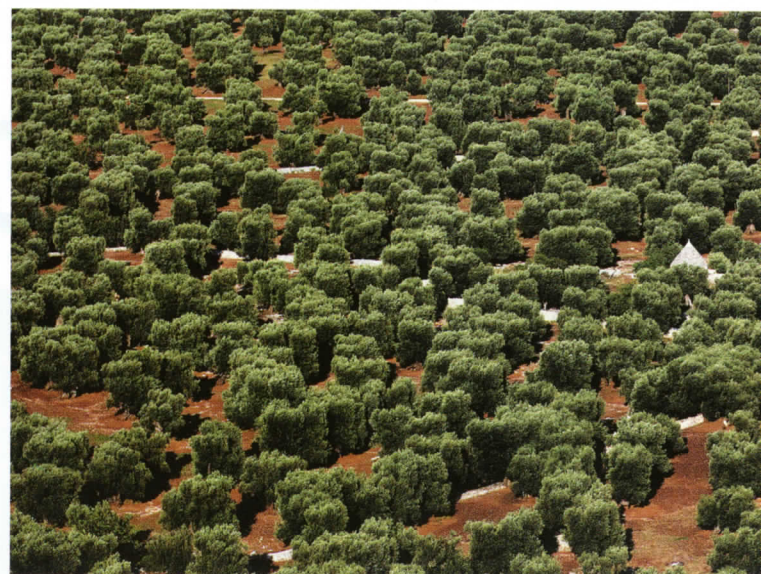
Secondo Premio categoria Colore: Antonella Natali, Valle di olivi secolari.

ne, il lavoro, i riti di raccolta e molitura, il colore dell'olio, gli oggetti che tradizionalmente sono ad esso legati, l'olio ed il cibo, le sagre e le feste sul mondo dell'olio.